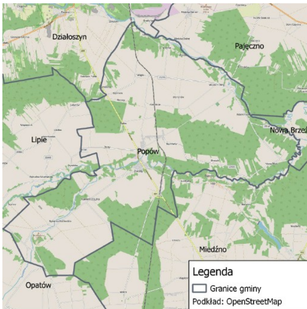
Rysunek 1 Mapa gminy Popów